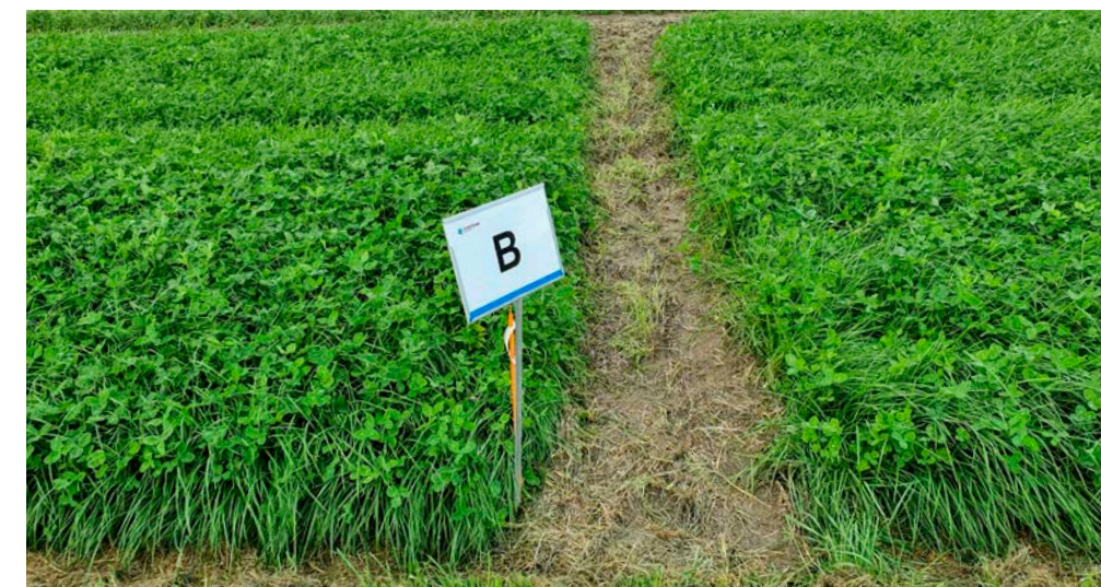
De werking van BlueN in een grasklaverperceel: links behandeld, rechts niet

Een biostimulant als BlueN mag ook gebruikt worden in de biologische sector. Het is niet giftig, koeien merken geen smaakverschil en kunnen prima grazen in behandeld grasland. De adviesprijs van 40 euro per hectare zet veel boeren aan het rekenen, merkt Jukema. 'Als je 30 kilo stikstof, ongeveer 100 kilo KAS-kunstmest, kunt besparen bij gelijkblijvende of hogere opbrengsten, dan is het concurrerend', zo besluit hij. 'Het grootste voordeel is dat je binnen de beschikbare stikstofruimte zorgt voor extra aanvoer van direct opneembare stikstof. Dat wordt door het wegvallen van de derogatie en het zevende actieprogramma steeds belangrijker. Dit soort natuurlijke stikstofbinders wordt een belangrijk stukje van de toekomstige bemestingspuzzel.' |